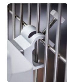
Soporte para Jaulas