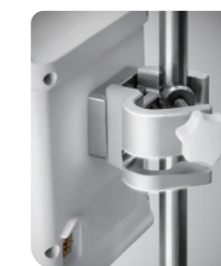
Soporte para Poste

Operación sencilla con guía rápida en el panel derecho